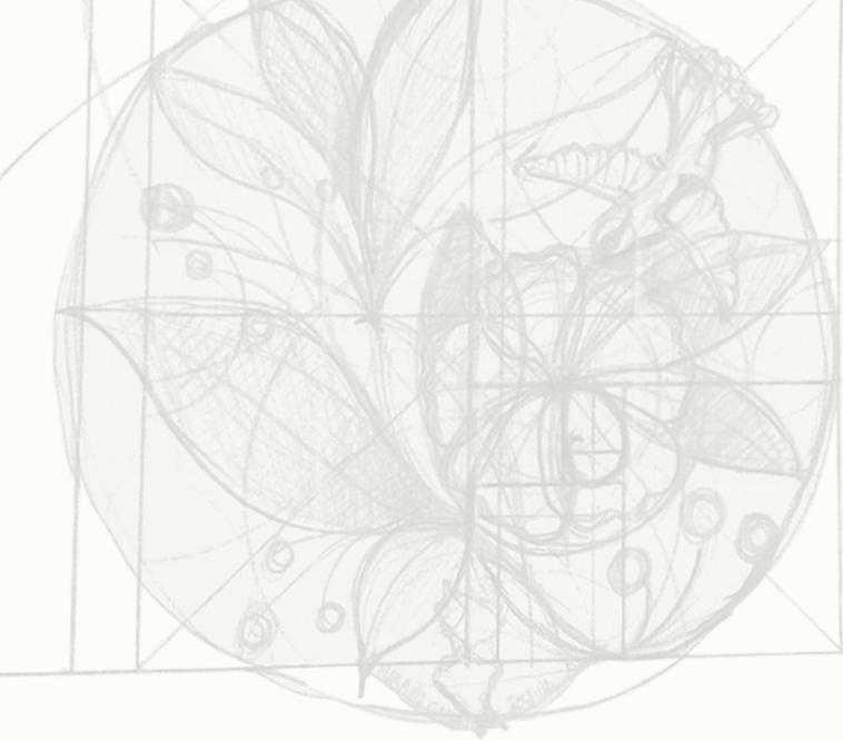
Boceto de la Medalla CIDAP: argó joyería de autor.