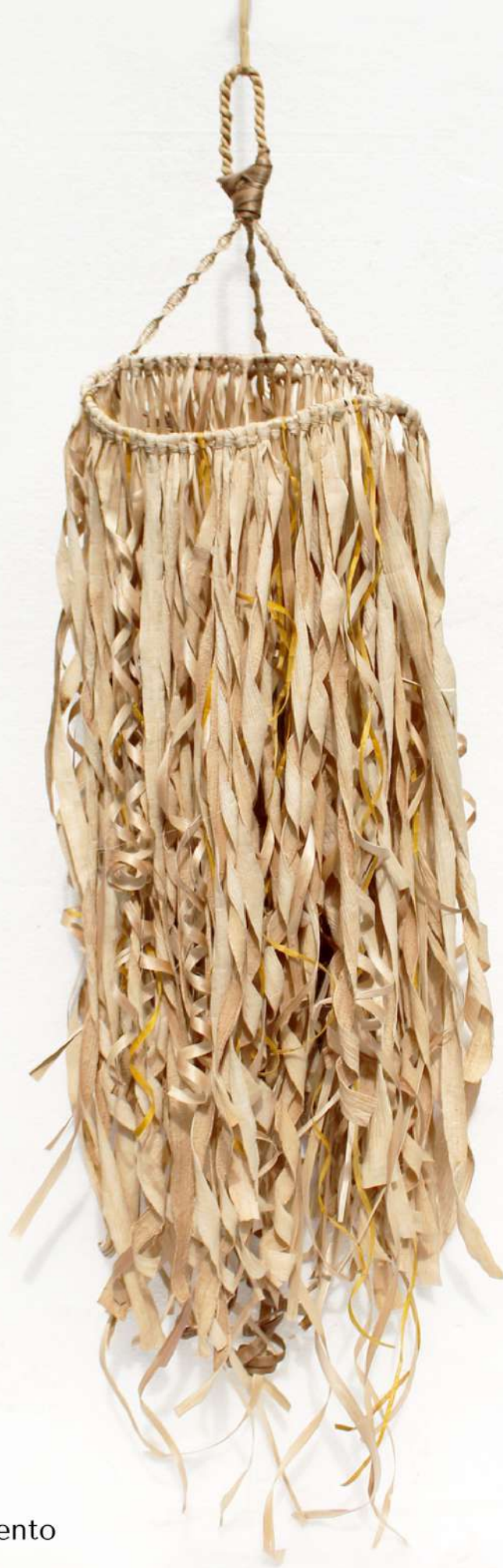
Fibras en movimiento Lorgia Cuenca Amarres con fibra de banano. 2023