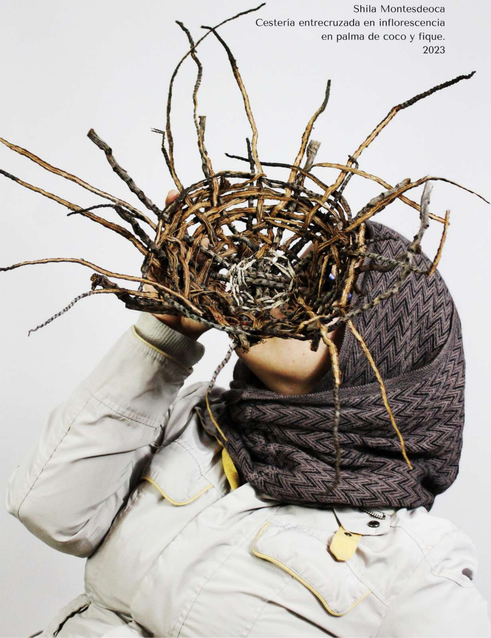
Ramificaciones Shila Montesdeoca Cestería entrecruzada en inflorescencia en palma de coco y fique. 2023