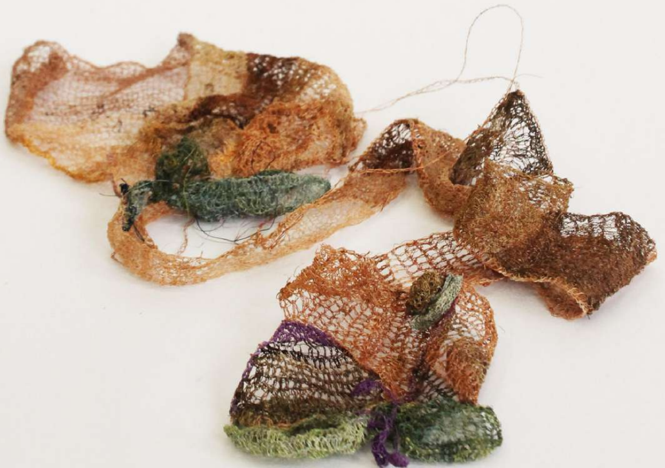
El salir a la luz ama ocultarse María Cecilia Abbet Tejido a crochet de fibra de agave y tinturado. 2023