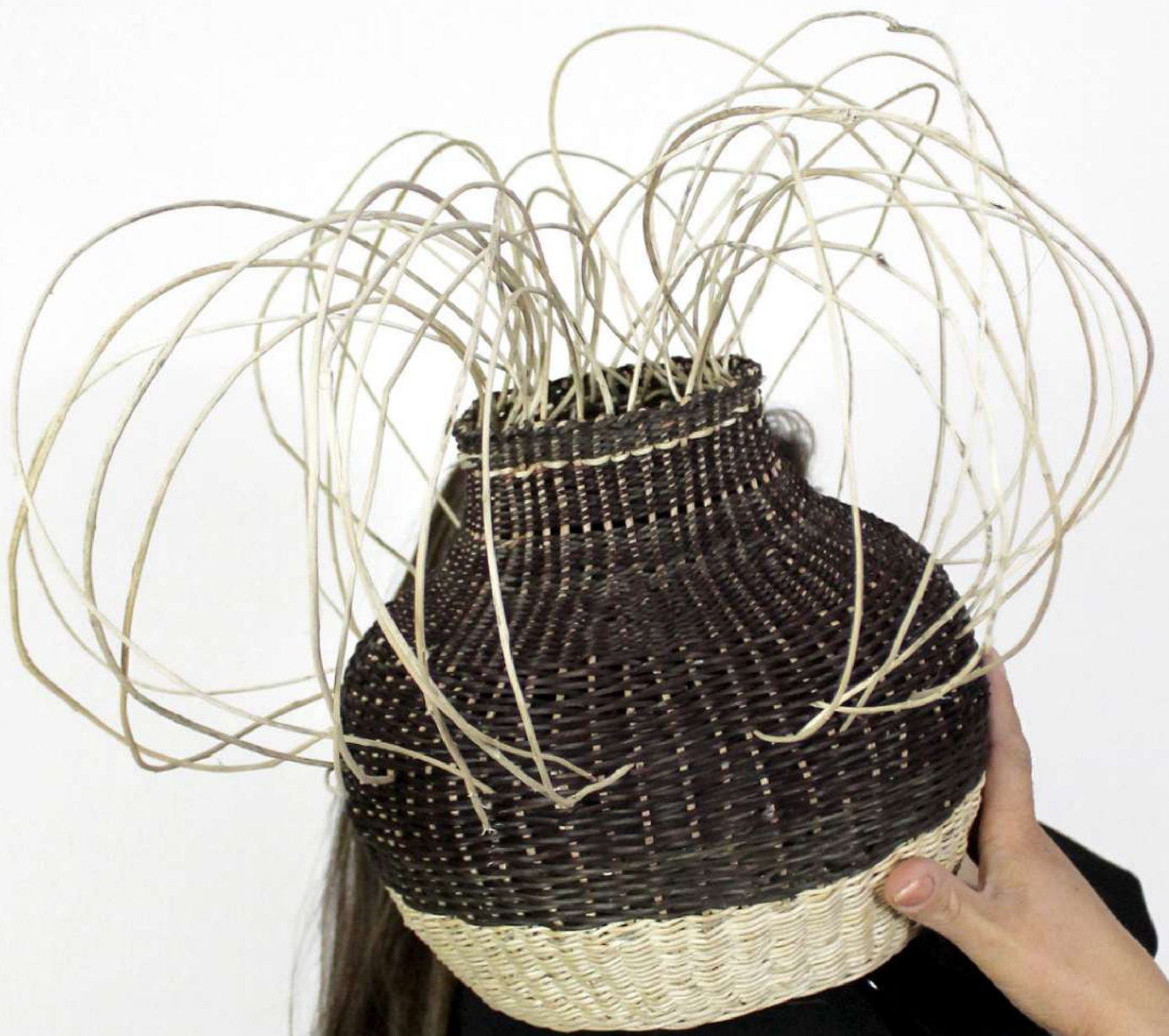
Frutera y contenedor Isabel Lienlaf Tejido básico en fibra de boquil pil pil. 2023