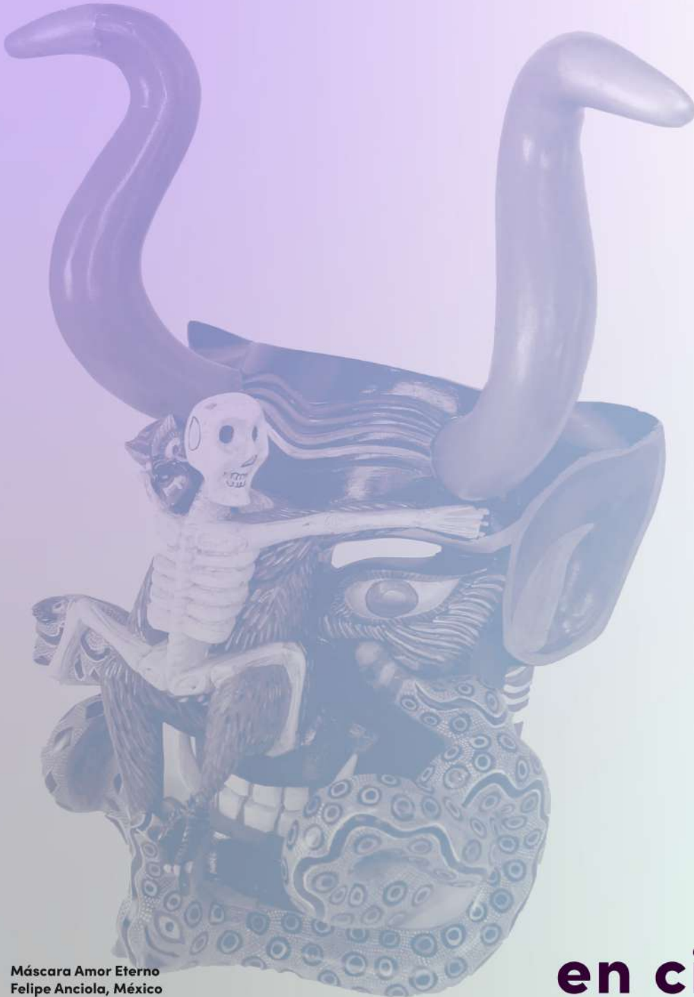
Máscara Amor Eterno Felipe Anciola, México